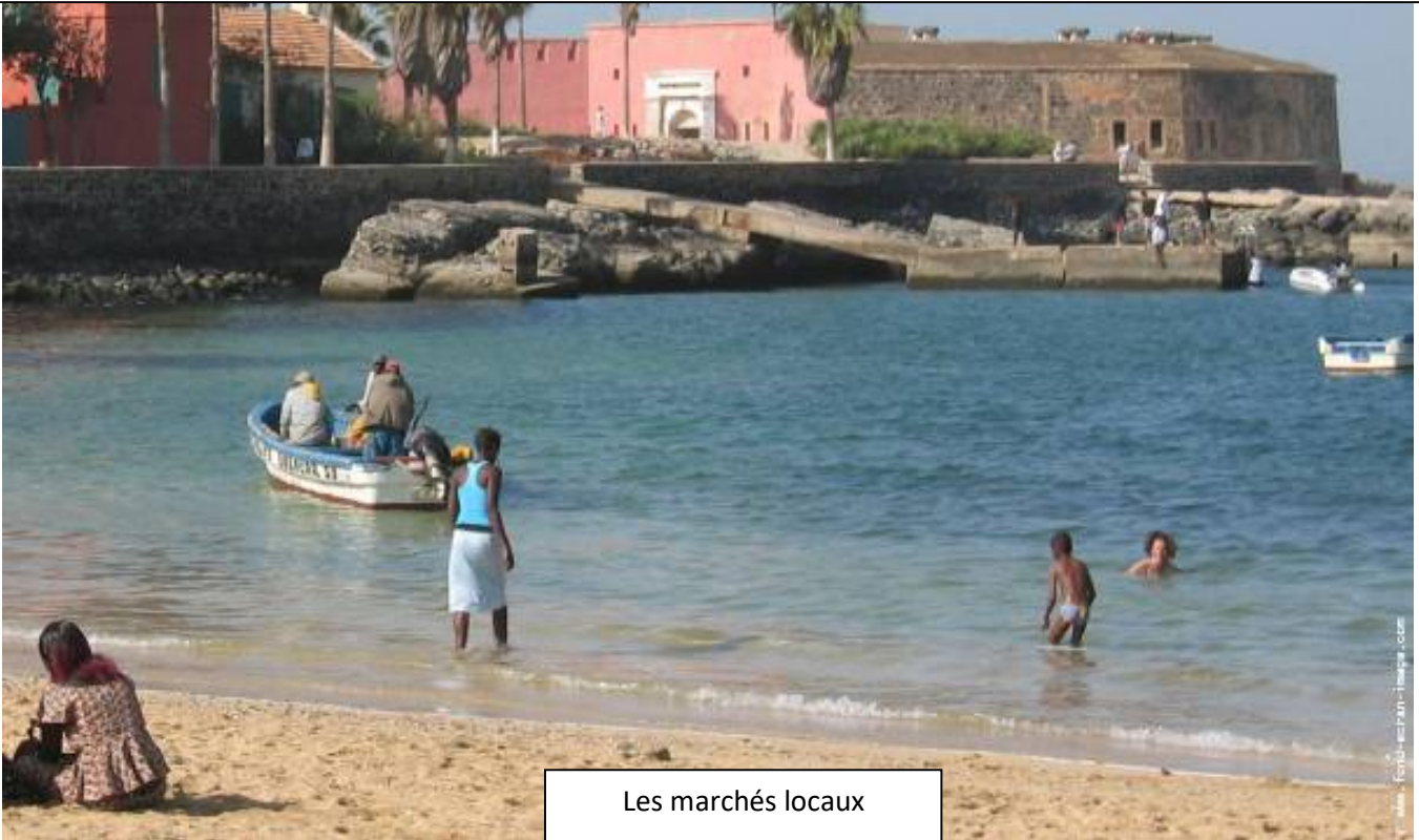
Les marchés locaux

Jour 15 : c'est la dernière journée de votre voyage mais votre vol est programmé en soirée. Vous allez donc vous diriger vers Dakar et son port. Là un guide vous attend, vous allez laisser votre moto pour prendre un chaloupe et la visite de l'île de Gorée tristement connue pour être le dernier voyage des esclaves vers l'Amérique. Au retour et toujours avec votre guide possibilité de visiter les différents marchés artisanaux.