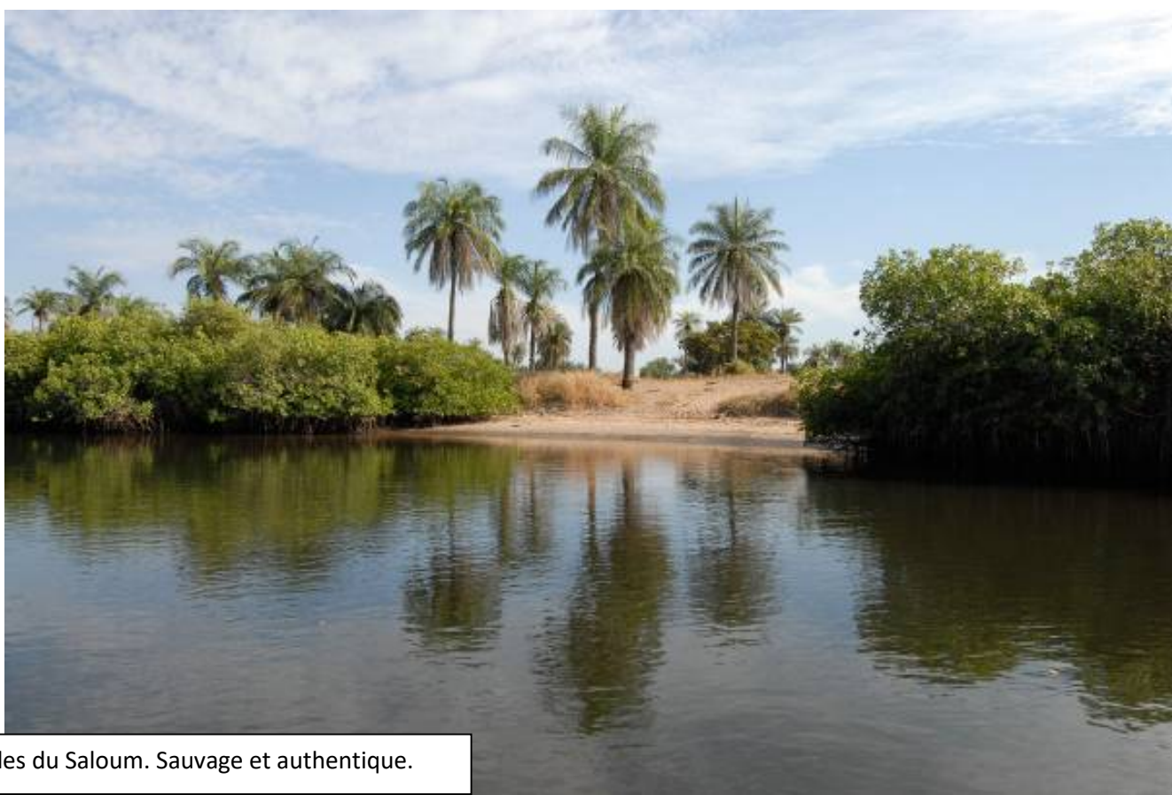
Les îles du Saloum. Sauvage et authentique.